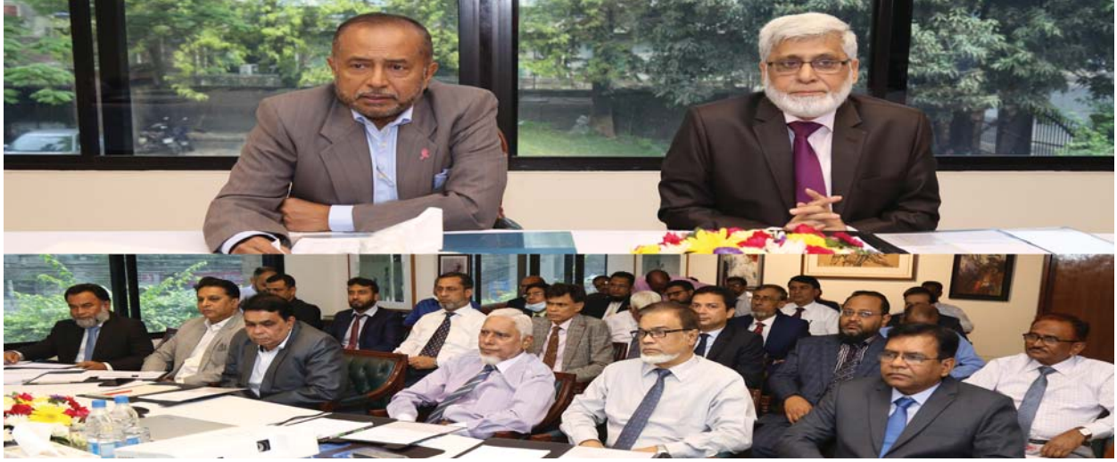
Participants at Branch Managers' Conference at Camellia House