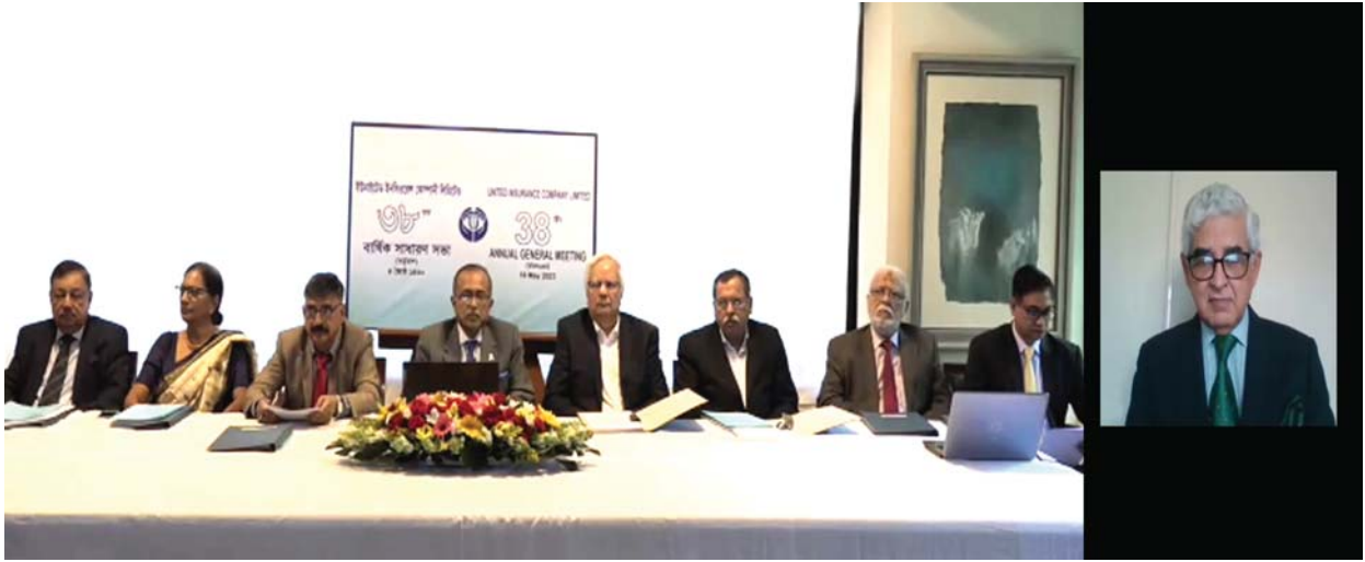
Directors at the 38 th Annual General Meeting held virtually by using Digital Platform

ইউনাইটেড ইনসিওরেন্স কোম্পানী লিমিটেড-এর পরিচালনা পর্ষদের পক্ষ থেকে কোম্পানীর ৩৯তম বার্ষিক সাধারণ সভায় আপনাদের সকলকে স্বাগত জানাতে পেরে আনন্দিত। পরিচালকমন্ডলীর অংশ হয়ে কোম্পানীর ৩১শে ডিসেম্বর ২০২৩ সালের বার্ষিক প্রতিবেদন এর সাথে সমাপ্ত বছরের নিরীক্ষিত আর্থিক প্রতিবেদন আপনাদের নিকট উপস্থাপন করতে পেরে অত্যন্ত আনন্দিত।